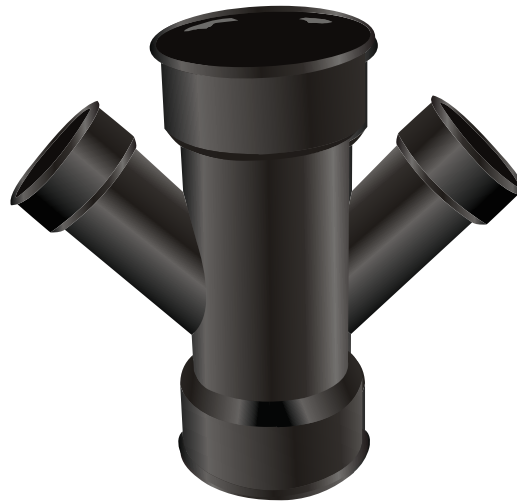
TEE WYE DOBLE